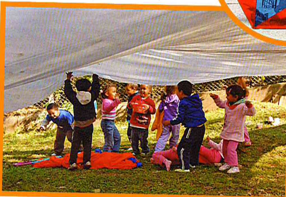
Uma das atividades uniu o universo da arte e do brincar, com brincadeiras e intervenções tridimensionais